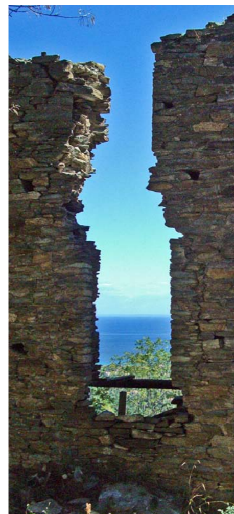
hameau de RAGHJA site du chantier de Jeunes Bénévoles